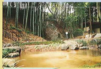
⑩ 曝井 (さらしい)