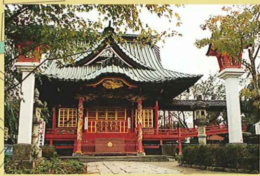
③ 二十三夜尊桂岸寺 新義真言宗豊山派