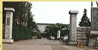
② 祇園寺 曹洞宗