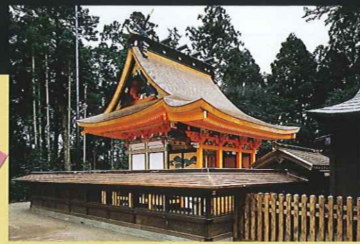
① 八幡宮 (国指定文化財)