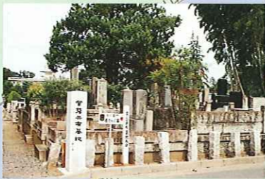
⑤ 常磐共有墓地 (水戸市指定文化財)