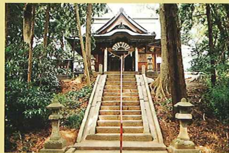
⑧愛宕山古墳 (国指定文化財・史跡) 頂きへ建つ ⑨愛宕神社 御祭神 火之迦具土神 (ひのかぐつちのかみ)